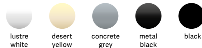
lustre white desert yellow concrete grey metal black black